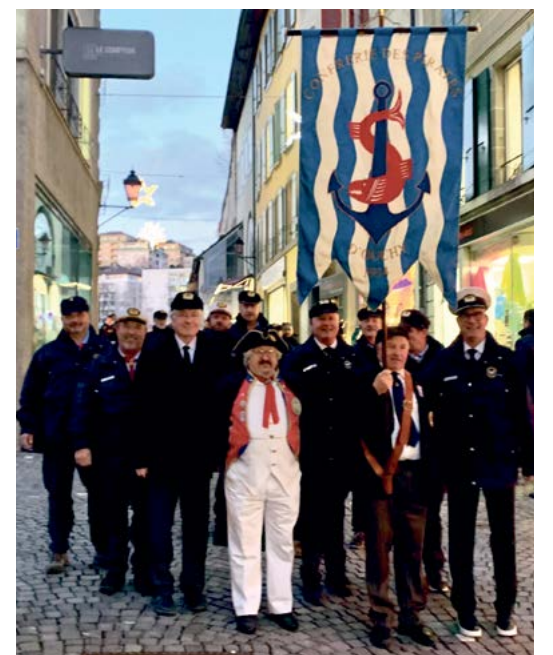
Préparation en vue de l'attaque de l'Hôtel de Ville

Cette attaque très pacifique et conviviale se termine au Carnotzet de l'Hôtel de Ville, puis au « 12 bis » avec la complicité des élus cantonaux.