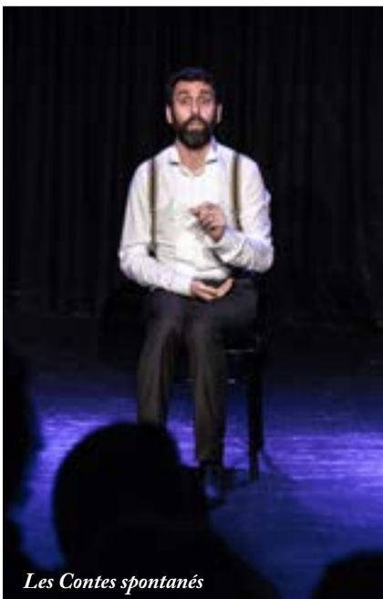
Les Contes spontanés