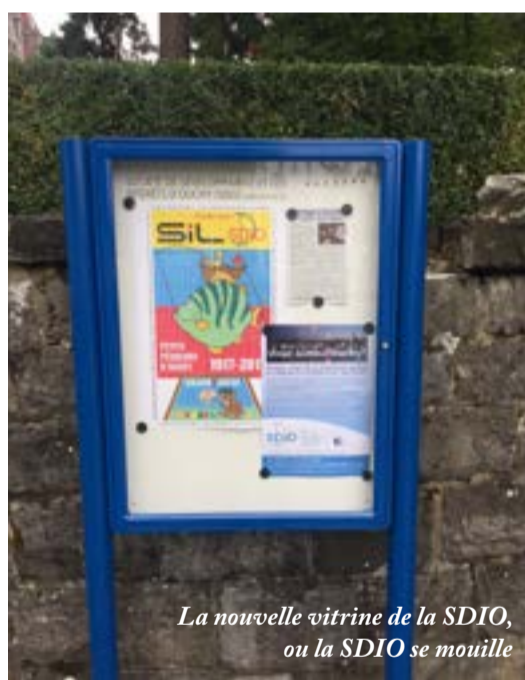
La nouvelle vitrine de la SDIO, ou la SDIO se mouille

Une grande campagne de promotion est en cours pour augmenter la visibilité de la SDIO sur Facebook. L'objectif est d'avoir rapidement deux mille personnes qui suivent la page de la SDIO. Ainsi nous aurons une communauté importante qui pourra être informée de ce qui se passe à Ouchy. Il sera alors possible de répondre à notre