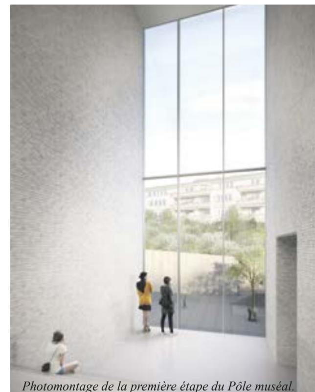
Photomontage de la première étape du Pôle muséal.

L'ensemble des maquettes ainsi que le projet du lauréat sont exposés au Palais de Beaulieu, salle 8, jusqu'au 16 octobre. Rappelons que le Musée cantonal des beaux-arts, le Musée de design et d'arts appliqués contemporains (mudac) et le Musée de l'Elysée prendront leurs nouveaux quartiers à quelques encablures de la gare, sur le site des anciennes halles aux locomotives des CFF. Le projet Pôle muséal, d'une ampleur inédite en Suisse, porté par l'Etat de Vaud, la Ville de Lausanne et les CFF, a pour ambition de profiler Lausanne comme une ville qui mise sur la culture, et ce de manière novatrice. Infos sur www.polemuseal.ch