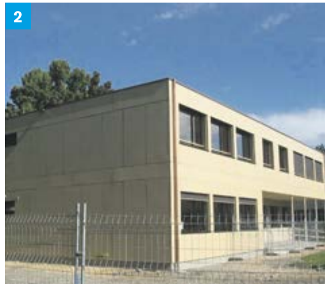
Trois étapes pour accueillir plus d'élèves à Montoie, un module volant, le même en place et une vue de l'intérieur.