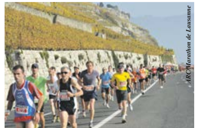
ARC Marathon de Lausanne

En raison de son succès, l'organisation mise en place l'an dernier pour les jeunes sera reconduite le samedi (mini-marathon enfants). Dimanche, départs des courses de Lausanne, place de Milan et de La Tour-de-Peilz pour le semi. La ligne d'arrivée commune à toutes les épreuves de cette journée se situera devant la fontaine du Musée olympique à Ouchy.