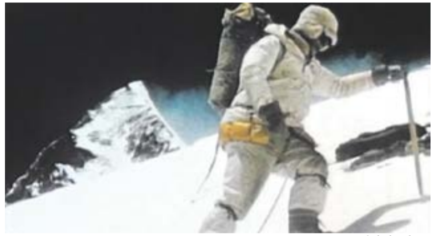
La moitié de la gloire