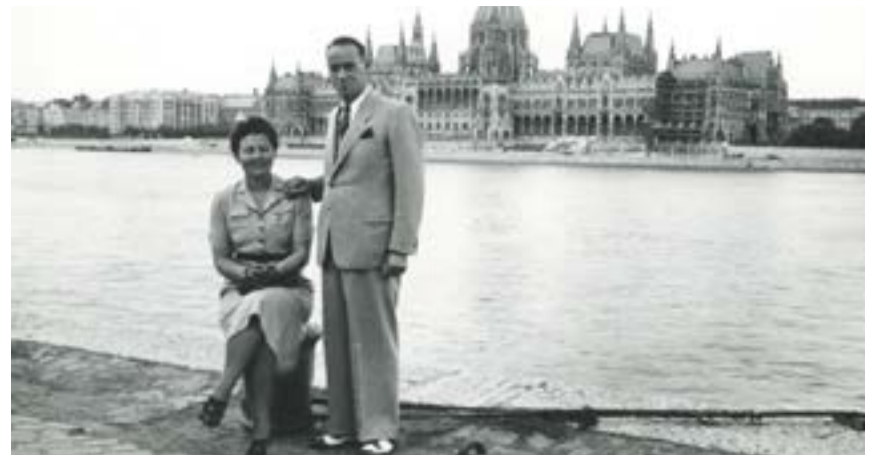
Carl Lutz le héros oublié