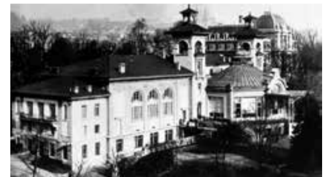
Le Casino de Montbenon, où s'installa le CIO à son arrivée à Lausanne en 1915.