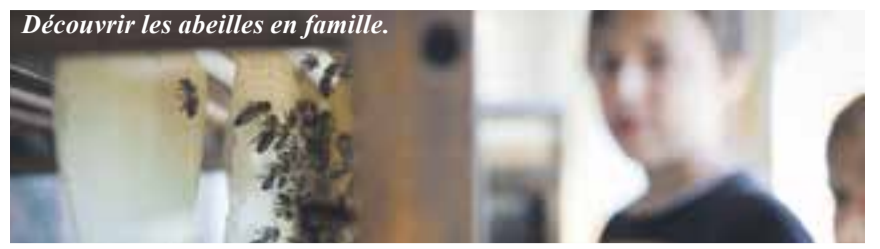
Découvrir les abeilles en famille.

Le programme de toutes les visites commentées et des ateliers de la fête à la place de Milan est consultable sur le site www.fetedelanature.ch