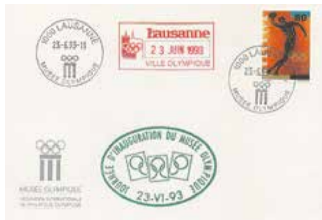
Enveloppe spéciale du jour de l'inauguration du Musée Olympique en 1993.