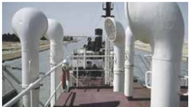
Canal de Suez, René Burri, Collections du Musée de l'Elysée.

Du 5 au 14 juin, Lausanne propose Objectif gare, un parcours artistique pour découvrir les collections du Musée des Beaux-Arts, du Mudac et du Musée de l'Elysée à travers vingt étapes en direction du futur Pôle muséal.