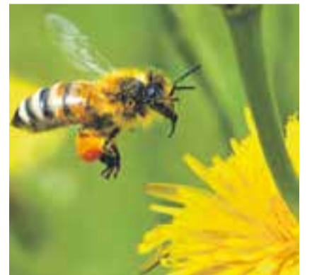
Voir page 7

Dimanche 31 mai, une grande fête printanière aura lieu au Jardin botanique à la place de Milan. Des animations, des visites guidées, des stands, des expos, il y en a pour tout le monde et c'est gratuit!