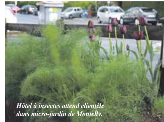
Hôtel à insectes attend clientèle dans micro-jardin de Montelly.