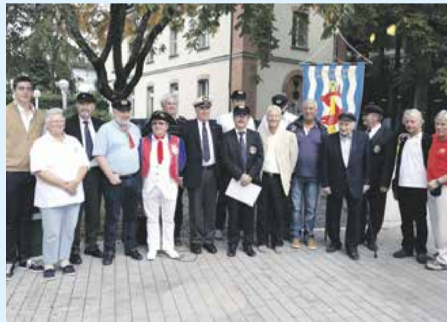
Les nouveaux bourgeois et bourgeois 2014