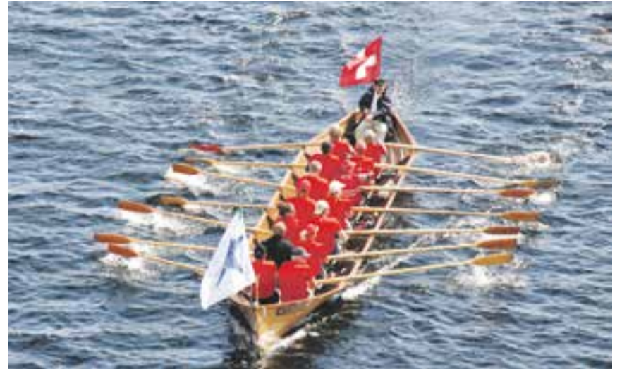
Ouchy, bien représenté, a brillé lors d'une course de 70 km.

court chemin, le lac). Cet équipage se paya le luxe de la victoire dans la catégorie, devançant les Finlandais de plus de vingt minutes... couvrant les 70 km de course en deux étapes en 6 h 38 min. A l'origine, il y avait le constructeur de barques à Sulkava, Kauko Miettinen qui, un soir de 1965 se remémora un vieux dicton de la région: « Un homme vigoureux est capable de boucler à la rame le tour de l'île Partalansaari entre le coucher et le lever du soleil » sans préciser la période de l'année, car en Finlande la nuit en juillet fait à peine trois heures alors qu'en hiver, elle en fait plus de vingt! En 1967, il réunit 36 solides rameurs prêts à relever le défi. Ainsi naquit la première course à la rame autour de la fameuse île et dont le prix au vainqueur fut une belle barque construite par l'organisateur.