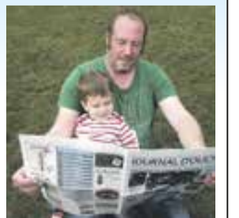
La photo gagnante de cette édition prise par Reynald Monod (le père) et Gaspard