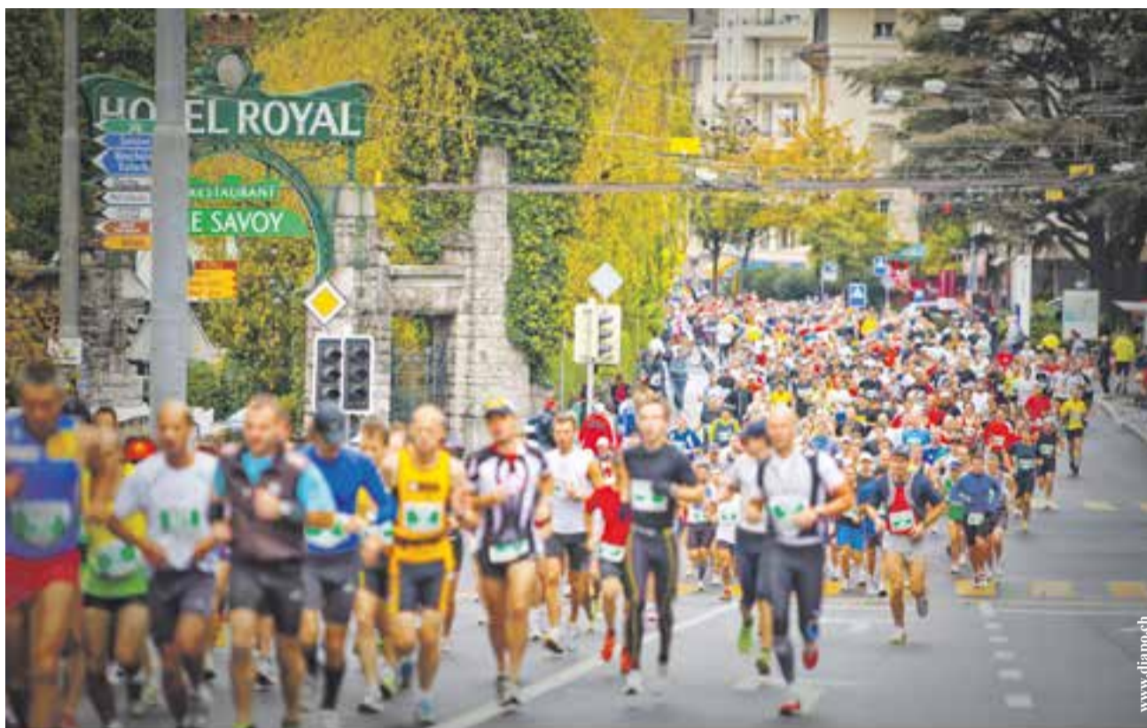
Les coureurs du Lausanne Marathon en plein effort vers le Royal Savoy.

Les 25 et 26 octobre, les participants – enfants et adultes – au 22 e Lausanne Marathon prendront le départ des différentes courses depuis Lausanne ou La Tour-de-Peilz. Cette année, les jeunes sportifs bénéficieront d'une nouvelle organisation privilégiant la sécurité et la convivialité.