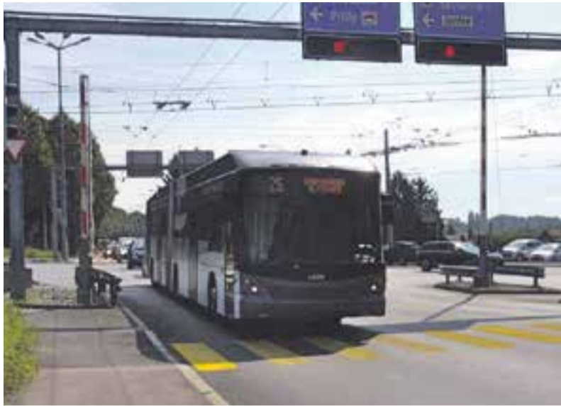
Le bus 25 franchit le carrefour de la Bourdonnette en empruntant la ligne prolongée

deux pas du Léman – musées Olympique, Elysée, Jardin botanique, Théâtre de Vidy, Espace des inventions, Musée romain, piscines et patinoire de Montchoisi, piscine de Renens. Mais elle raccorde également à la gare CFF de Renens toute une zone appelée à se développer et se densifier ces prochaines années aux portes du campus universitaire. En effet, cette nouvelle ligne 25 accompagnera le développement du futur éco quartier des « Prés-de-Vidy » du projet de Métamorphose ainsi que du secteur des Côtes de la Bourdonnette à Chavannes-près-Renens. Ce dernier regroupera des logements pour étudiants, des appartements et le futur « Campus Santé » qui rassemblera toutes les filières de la Haute Ecole de santé Vaud.