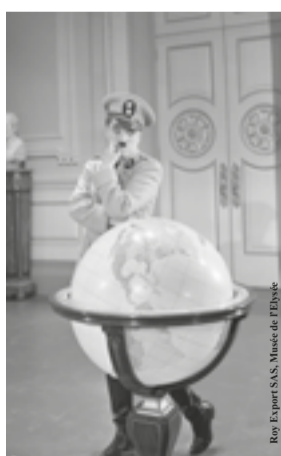
Le Dictateur, premier film parlant de Chaplin

En 1914, l'Amérique découvre ce jeune comédien de music-hall sur les écrans des cinématographes. En quelques mois, Chaplin devient l'une de leurs vedettes, se démarquant par sa défroque, son style. En 1918, il tourne Charlot soldat , un Charlot héroïque qui réussit à capturer le Kaiser, alliant situations co-